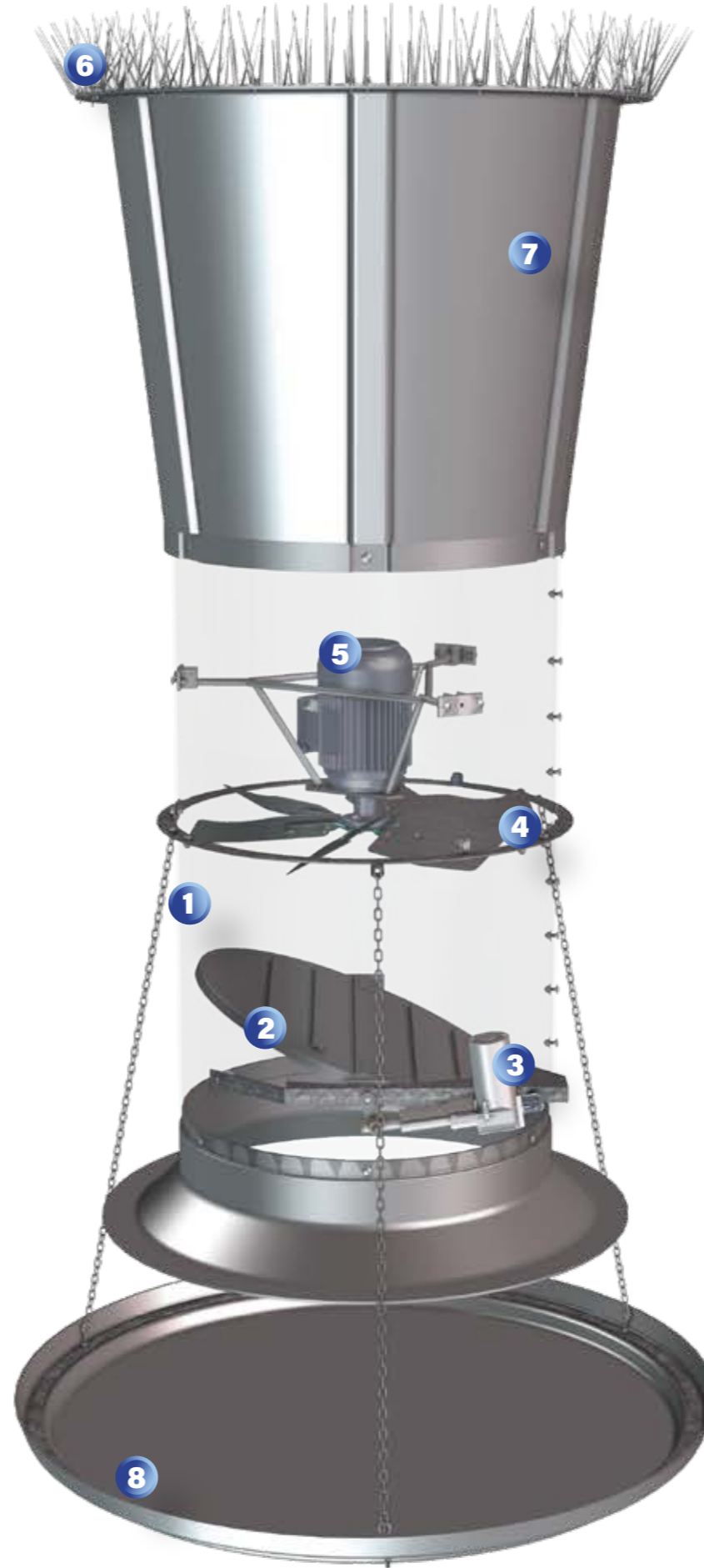
Ürün üzerinde bulunan numaralar ürün montaj sıralamasını belirtmektedir.

0.55 kW 1000 devir elektrik motor kullanılmıştır. Kanadın dönmesini sağlayarak, hava akışı oluşturmaktadır.