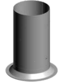
BFN - 003 ve BFN001