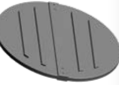
SGMAL - 467

Yuvarlak şekli, kolay ve verimli havalandırma sağlar. Polietilen malzemeden üretilmiştir. 61,5 cm iç çapa sahiptir. Özel tasarımı sayesinde minimum gürültüye sahiptir. Fan gövde kısmında m6x20 bombe baş imbus civata kullanılmıştır.