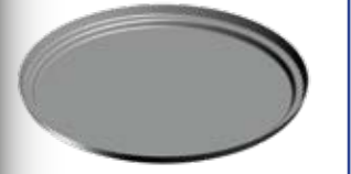
BFN - 004

Çevreden gelen cisimleri haznede tutarak doğrudan içeri girmesine engel olur.