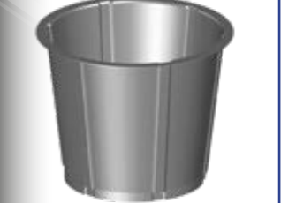
BFN - 002

Hava akışını en uygun şekilde sağlayacak tasarım yapılmıştır. Kolay montaj özelliğine sahiptir. Hava akışında %15'e kadar artış sağlamaktadır, bu artış sayesinde %15 enerji tasarrufu elde edilmektedir.