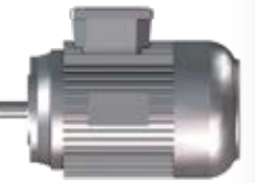
SMTR - 808

580 mm kanat çapı kullanılmıştır. Maksimum Hava akışı ve minimum ses seviyesi oluşturacak şekilde dizayn edilmiştir. Korozyona dayanıklıdır. Magneliz ve Paslanmaz çelik seçeneği mevcuttur. Flanşı kanat üzerine monte etmek için m8x15 imbus civata kullanılmıştır.