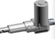
HEKE - 160

Hava akış kontrolünü sağlar. Hava akış miktarı isteğe göre ayarlanabilir. Klapeler sayesinde fan kapalı konumdayken dışardan gelen yabancı cisimlerin içeri girmesini önler. Klapeler montajında m6x45 civata kullanılmıştır.