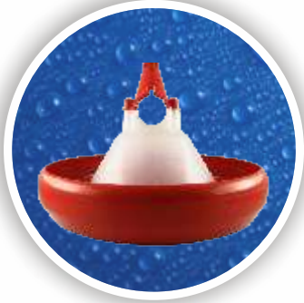
Broyler Yemliđi Broyler Feeder Pan BYM03-0001