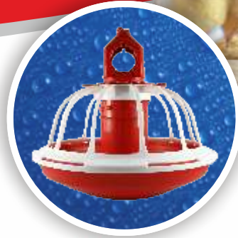
Broyler Yemliđi Broyler Feeder Pan BYM02-0201