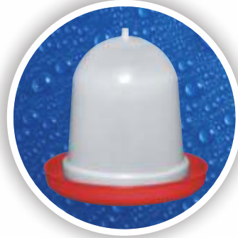
Hindi Suluđu Turkey Drinker SHS01-0000