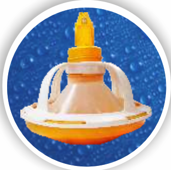
Broyler Yemliđi Broyler Feeder Pan BYM01-0101