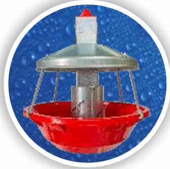
Hindi Yemliđi Turkey Feeder HYM01-0001