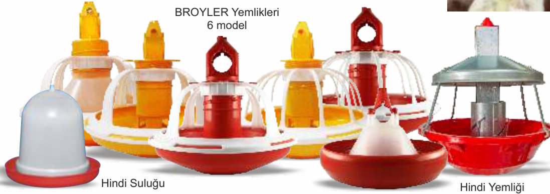
BROYLER Yemlikleri 6 model

ALFAN plastik sulukları da otomatik sulama sistemlerinde kullanılmaktadır. Suluktaki su zaldıkça su deposunda bulunan su otomatik olarak suluğa inmektedir.