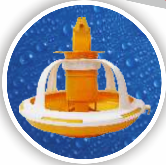
Broyler Yemliđi Broyler Feeder Pan BYM01-0202