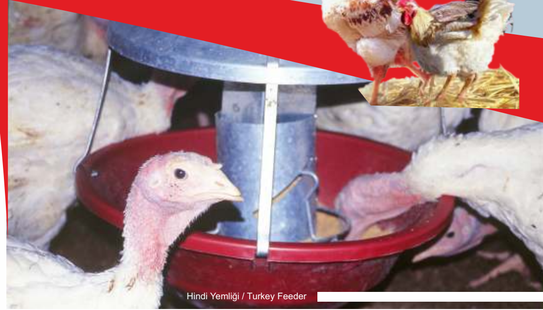
Hindi Yemliği / Turkey Feeder

Alfan Climatic Control is a temperature control device which can evaluate the sensed temperatures in line with the entered parameters by the sensors on it. The temperatures of the ambience where is located of sensors can obtain on intended heat by entered programs on the device.