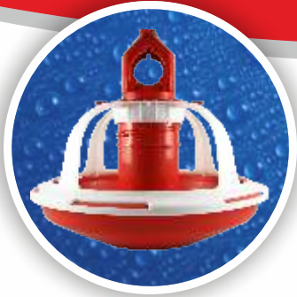
Broyler Yemliđi Broyler Feeder Pan BYM01-0201