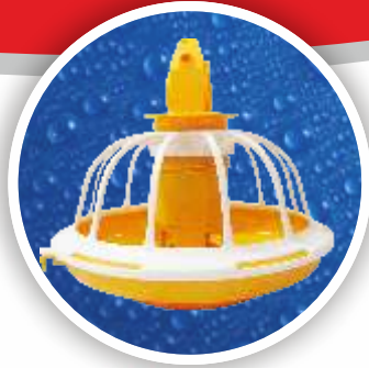
Broyler Yemliđi Broyler Feeder Pan BYM02-0202